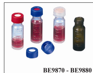
BE9870 - BE9880